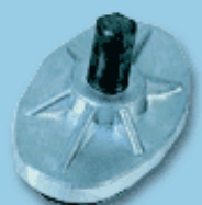
PA piatto appoggio supporting plate