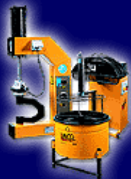
Attrezzature per autofficine Tyre repair and workshop equipment