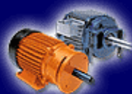
Motori elettrici Electric motor