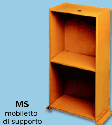
MS mobiletto di supporto support